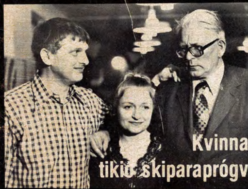
Kvinna tikið skiparapróg